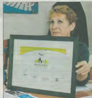
Troyes a obtenu l'an passé le prix spécial intergénérationnel lors d'un concours national

Programme Lundi 15 octobre : thé dansant à la salle des fêtes de l'hôtel de ville de 14 h à 17 h 30.